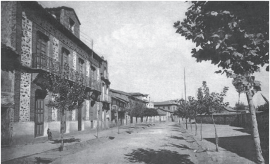
Avda. Primo de Rivera

Subdirector General del Ministerio de Trabajo, Presidente de los Tribunales Mixtos, Secretario particular del Presidente del Gobierno Don Eduardo Dato, Académico correspondiente de la Historia, estaba en posesión de la Orden de Isabel la Católica, Hijo Ilustre y Medalla de Plata de La Bañeza.