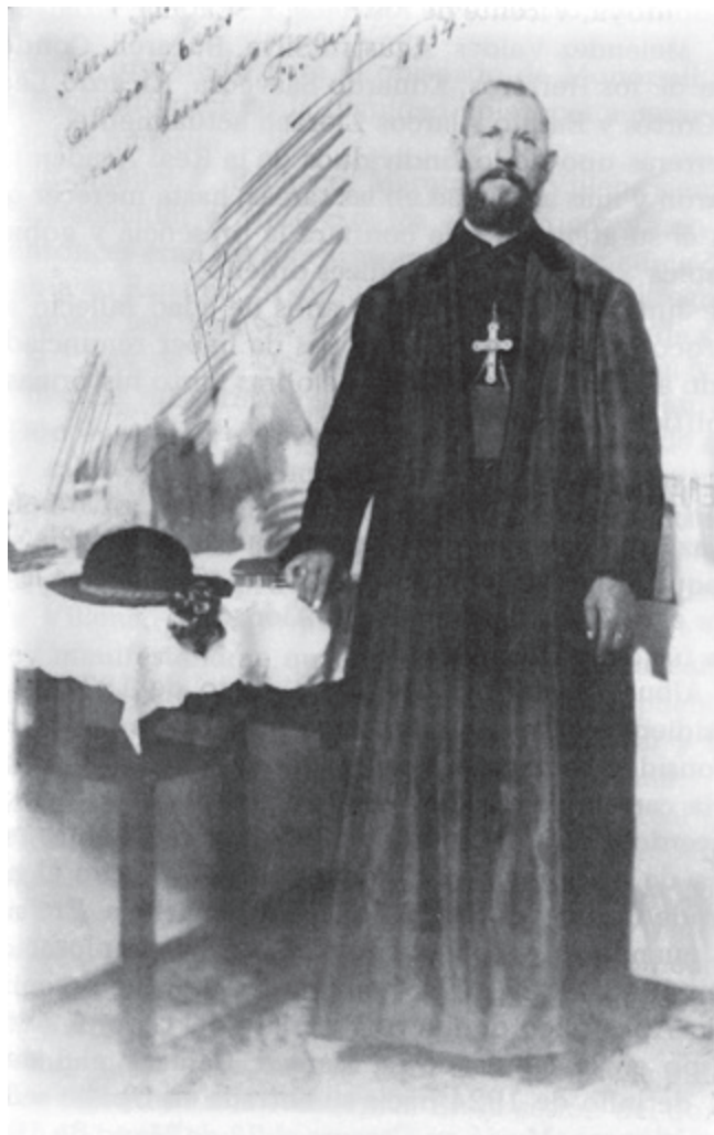
Fray Diego Alonso

de pez y, mientras ardía tenían lugar animados bailes acompañados por tamboril, gaita y panderetas. La fachada de la iglesia se iluminaba con cientos de lamparillas de aceite, empleándose para este fin cáscaras de huevo previamente coloreadas.