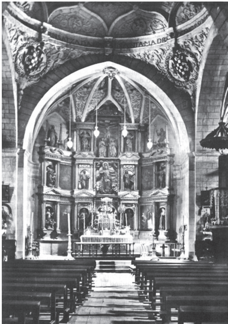
Retablo Iglesia Santa María