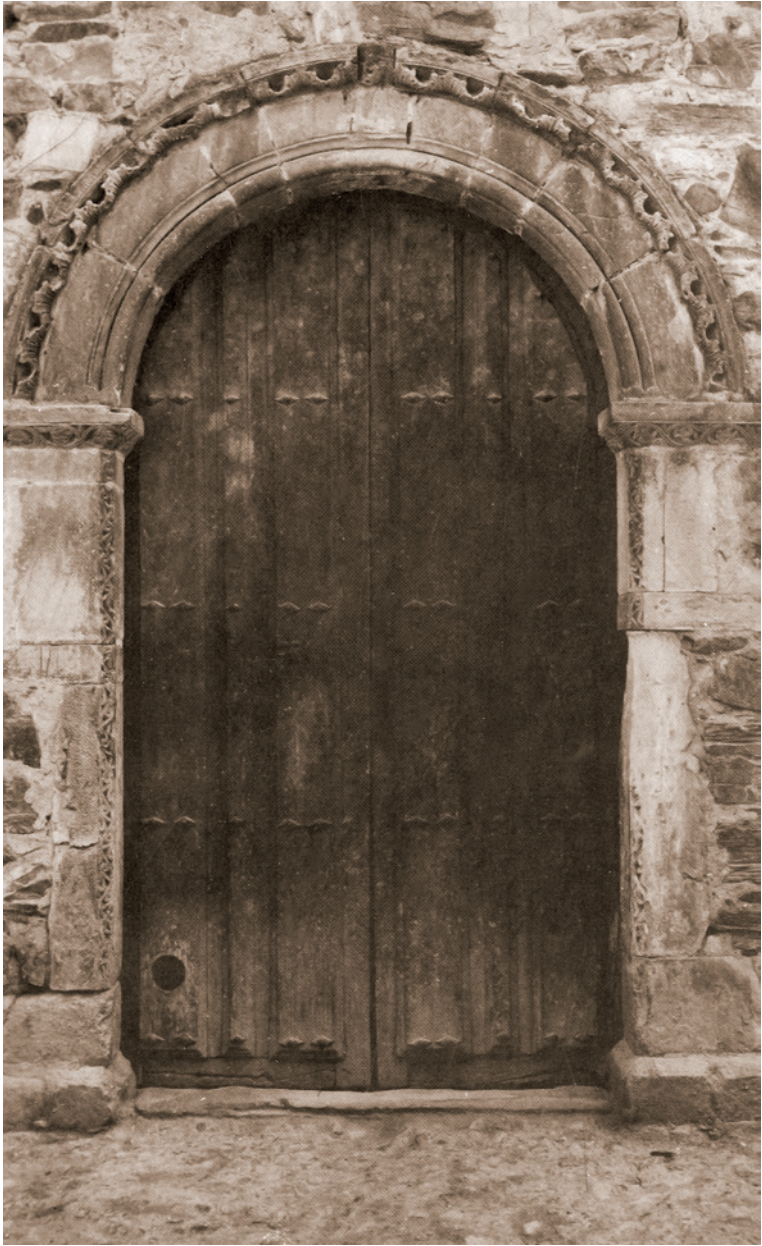
Portada de la antigua iglesia de la Piedad (La Bañeza) Obra del Maestro Mateo, siglo XII