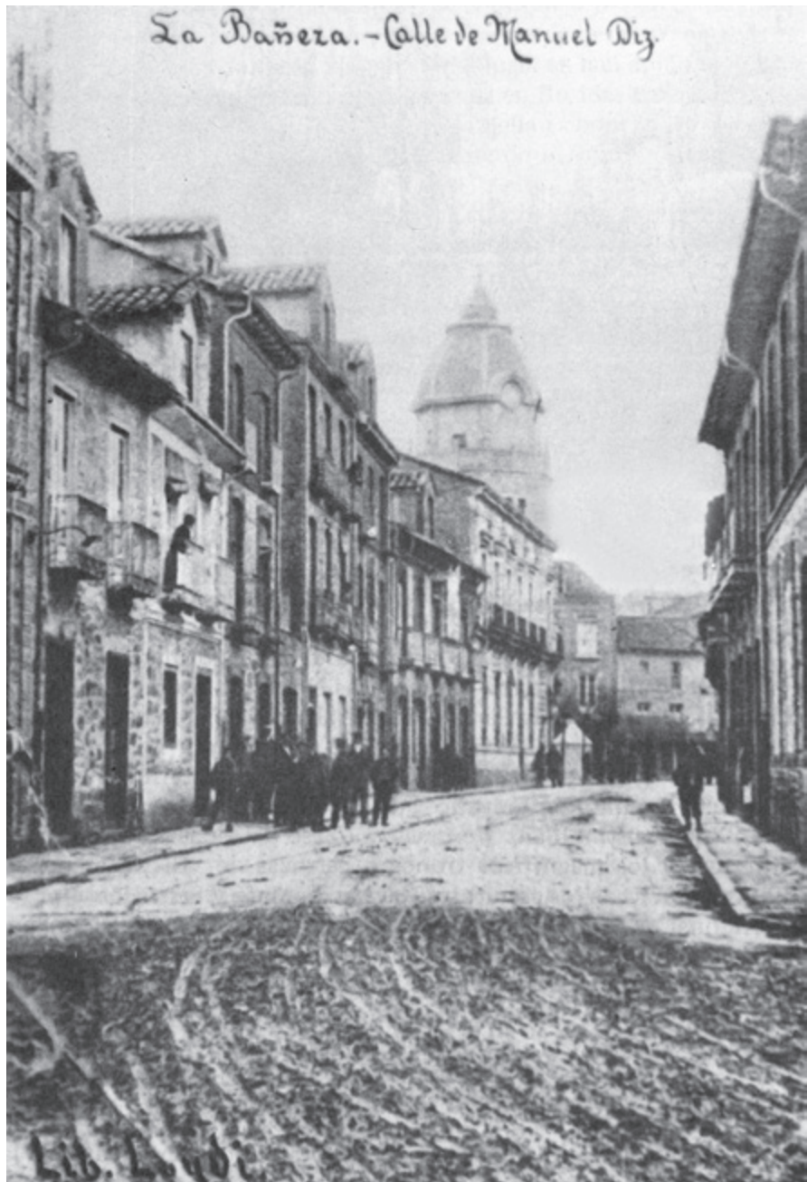
La Bañera. - Calle de Manuel Diz.