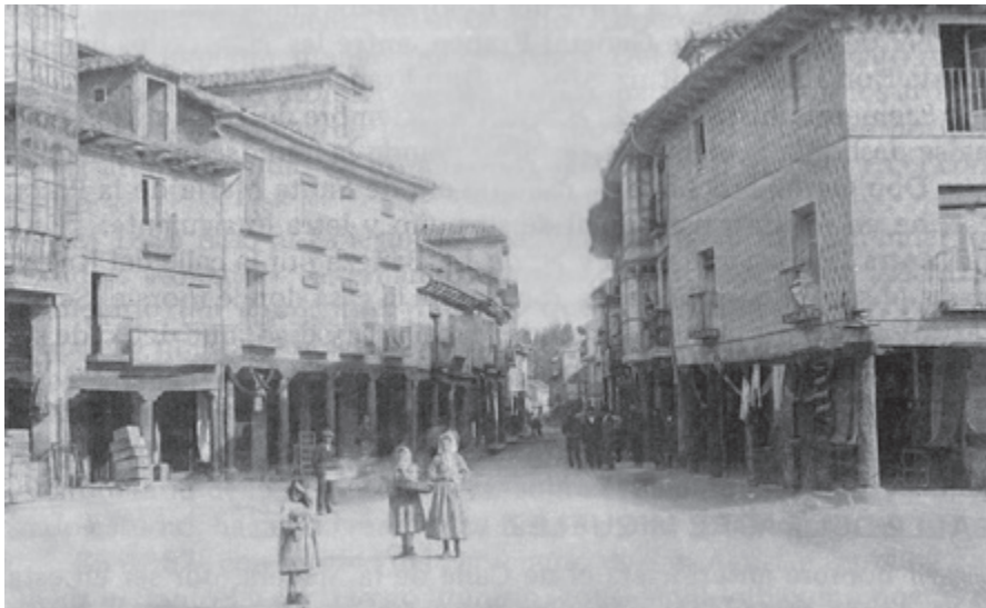
Calle de Astorga