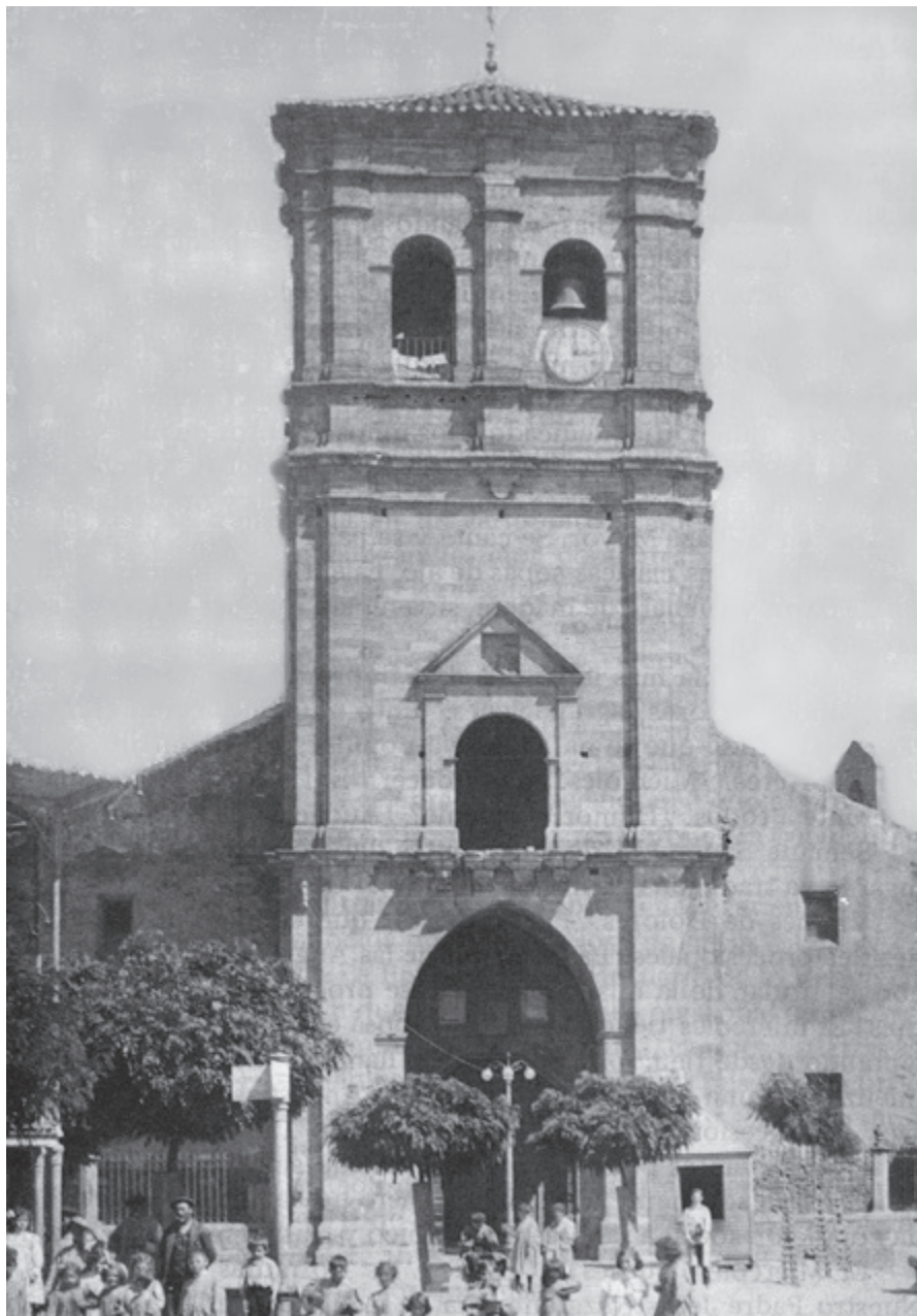
Iglesia de Santa María