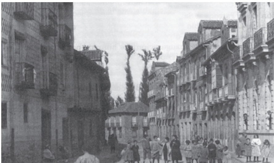
Calle de la Fuente

Está considerado por la crítica literaria como uno de los poetas más valiosos de la nueva poesía española y, en concreto, como la “voz más pura” de esta poesía. Ha publicado varios libros de poemas, que han sido distinguidos con distintos premios literarios. Así, su primer libro, “Poemas de la tierra y de la sangre”, recibió en 1968 el primer premio convocado con ocasión de la celebración del XIX centenario de la ciudad