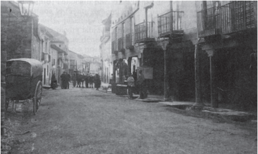
Calle Juan de Mansilla

donde se vendían y alquilaban toda clase de disfraces, principalmente el clásico y popular dominó, y se celebraban los fabulosos y concurridísimos bailes del “Recreo”, del “Variedades”, “Liceo” y del “Casino”.