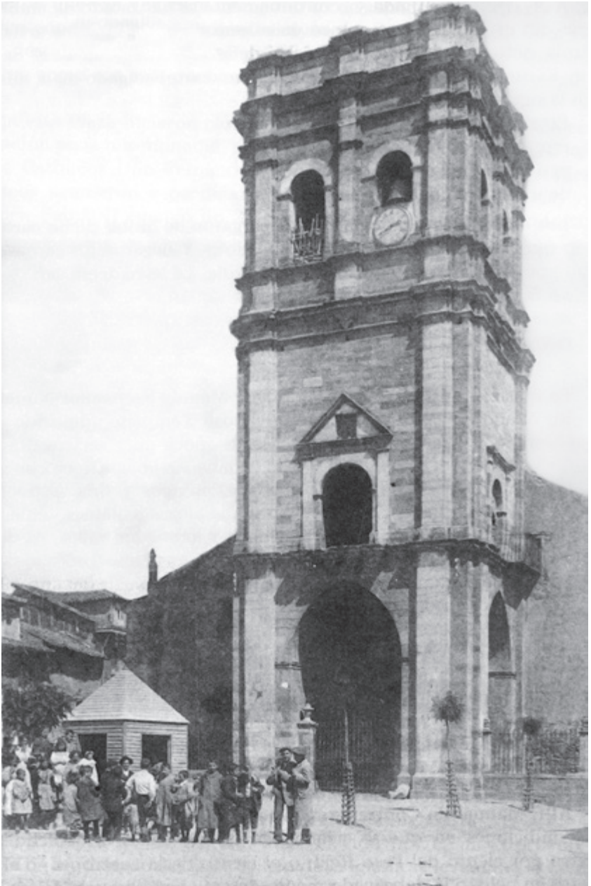
Iglesia de Santa María