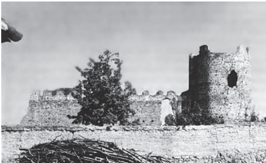
Castillo de Palacios de la Valduerna

Alfonso V, tuvo su palacio en Valduerna, más tarde Palacios del Rev o Palacios de Valdeladuerna.