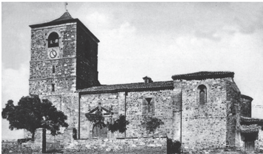
Iglesia de El Salvador

Sesenta y cinco años más tarde, Mohamed ben Abdallah, conocido por Almanzor, que quiere decir el victorioso, desencadena una de las más terribles incursiones. Se dirige a Galicia y a su paso arrasa Zamora, León, Astorga y cuantas iglesias y monasterios encuentra a su paso.