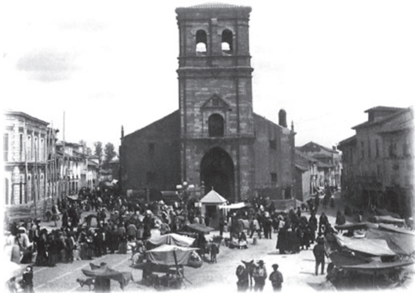
Plaza Mayor (Mercado 1908)

En esta Plaza hicieron parada muchos regios e ilustres personajes, la relación sería interminable, pero, no puedo por menos de citar a los Reyes Católicos Don Fernando y Doña Isabel cuando, como hábiles políticos, acudieron a pacificar a la revuelta nobleza de Galicia, y también Felipe II cuando un 22 de mayo del año 1554, siendo todavía Príncipe