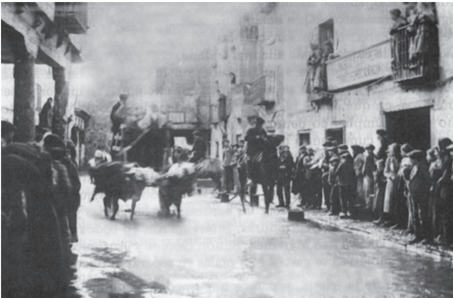
Calle del Reloj (hoy General Franco)