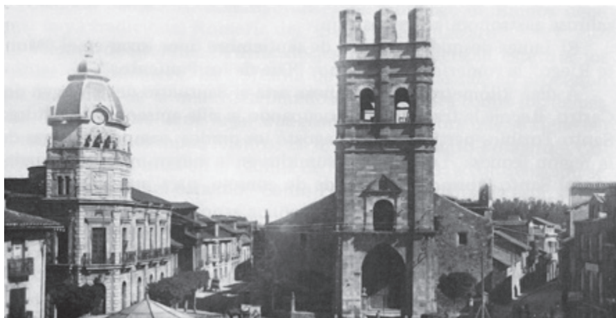
Ayuntamiento y Torre de Santa María

Otro plato típico de La Bañeza y su región, son las sopas de ajo, diferentes a otras que llevan la misma denominación. Se sirven en cazuelas de barro de Jiménez de Jamuz, con su correspondiente cuchara