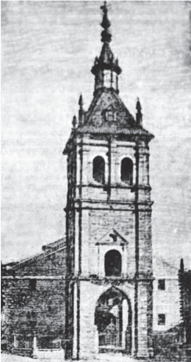
Iglesia de Santa María (antes del incendio)