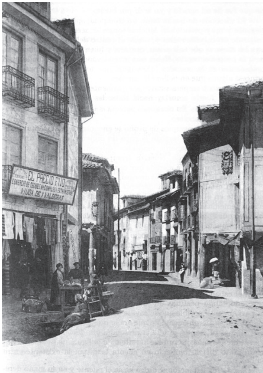
Calle General Franco