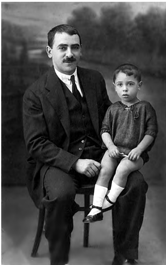
Con su padre