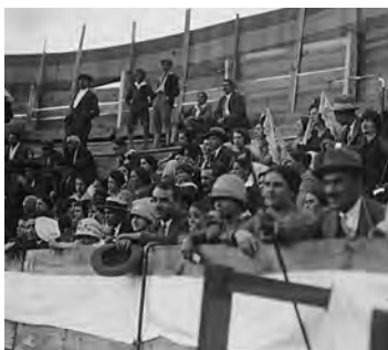
En los toros