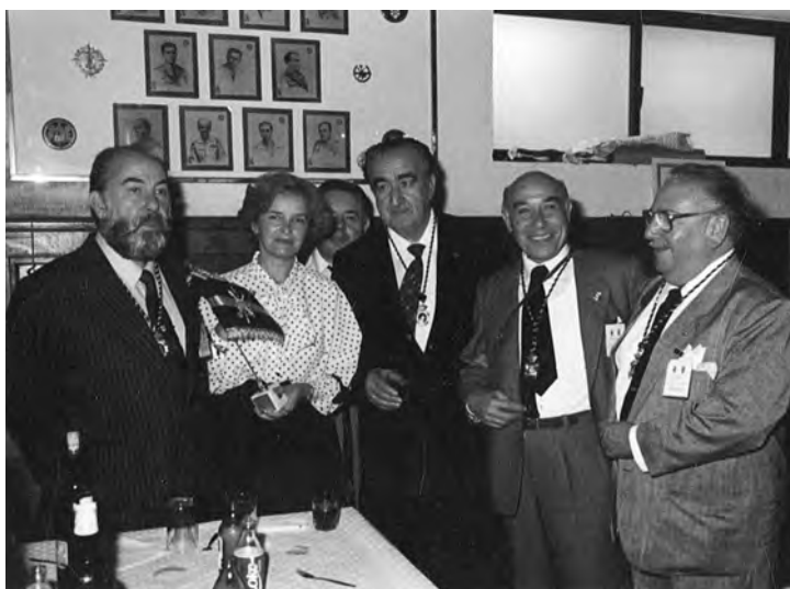
Congreso de Cronistas en Ceuta