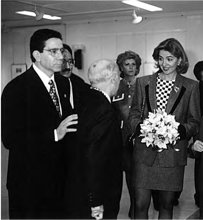
Hablando con la Infanta D o Cristina en su visita a La Bañeza