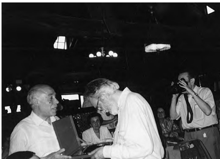
Entregando una placa en el homenaje a Pereira