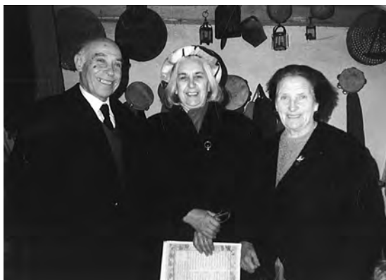
Poesía en los telares de Dolores