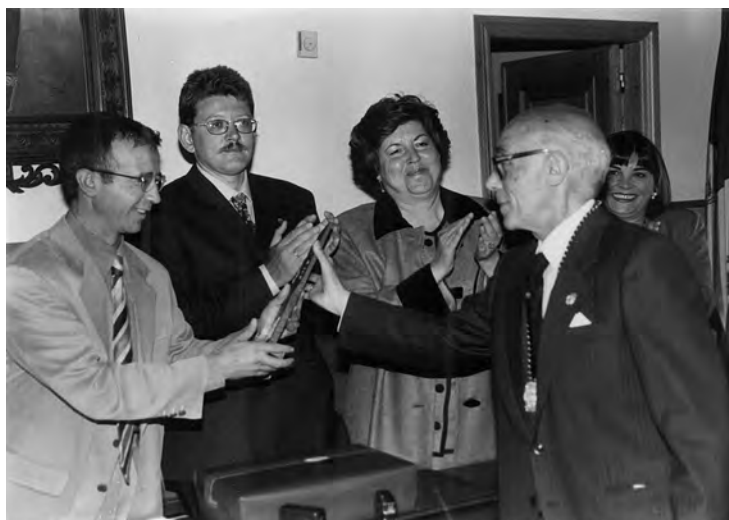
Dos instantáneas del día que recibió la Medalla de Plata de la Ciudad en el año 1997. Arriba en el salón de sesiones y abajo a la salida del ayuntamiento con la Banda Municipal tocando en su honor