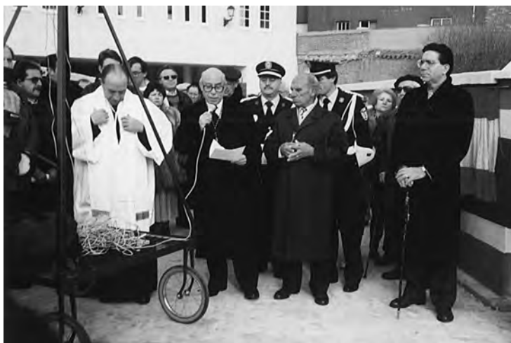
Inauguración de la Plaza del Centenario en La Bañeza