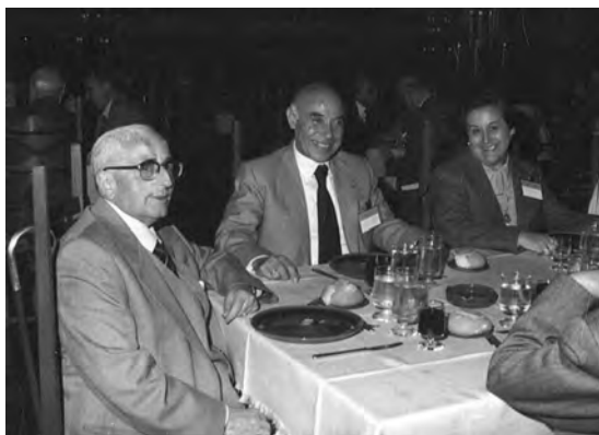
En un banquete junto a Hermida