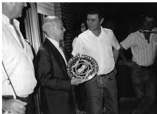
Conferencia en Valdefuentes del Páramo