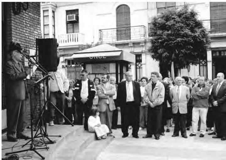
Interviniendo en la inauguración de la Avenida Vía de la Plata en nuestra ciudad