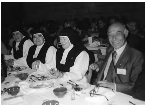
Con religiosas del Císter en Oseira