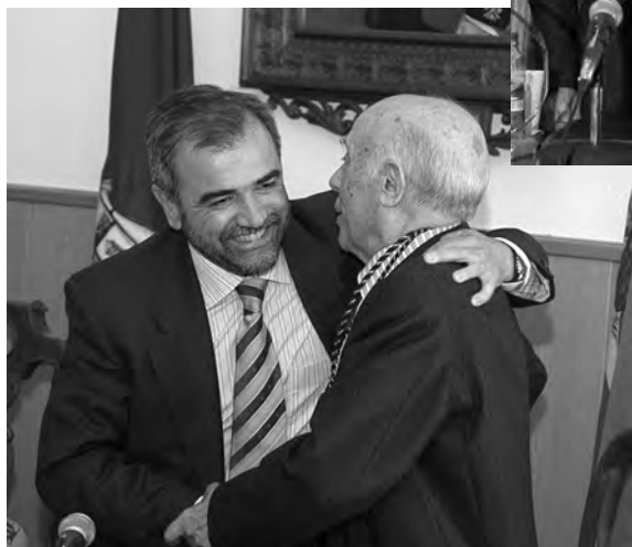
Fotografías del Salón de sesiones. Recibiendo la "Alubia de Oro" y con la reproducción de la portada de "El Adelanto"