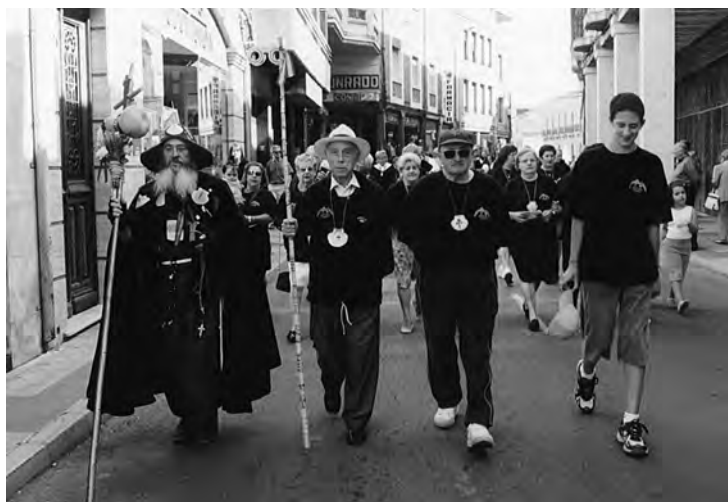
Presidiendo la marcha del "Día del Peregrino" en el año 2004