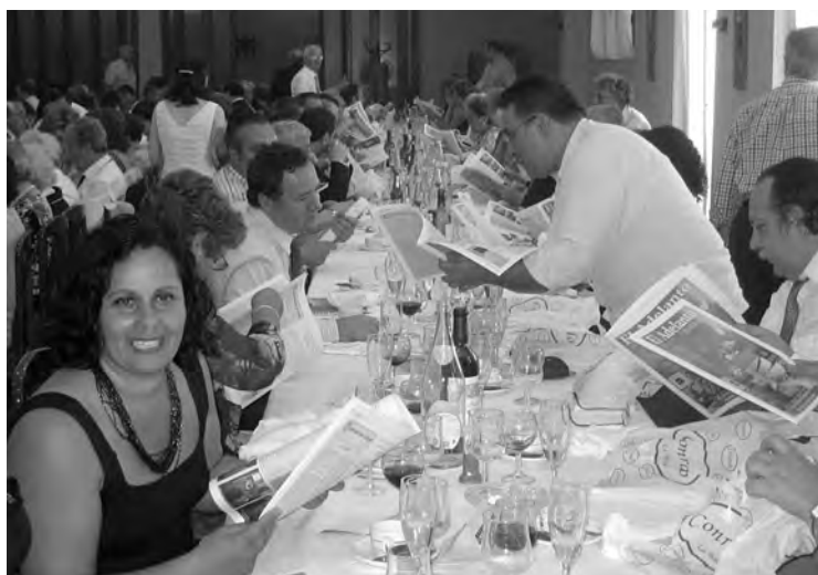
Dos vistas del comedor donde se realizó el banquete de homenaje